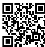
TABLE CUISSON INDUCTION PUNTO - NOIR 58x51 4 ZONES